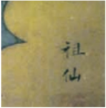
蓮の絵の端に落款あり。「狙仙」は60才の時「狙仙」に変わった。これは、若い時の絵だ